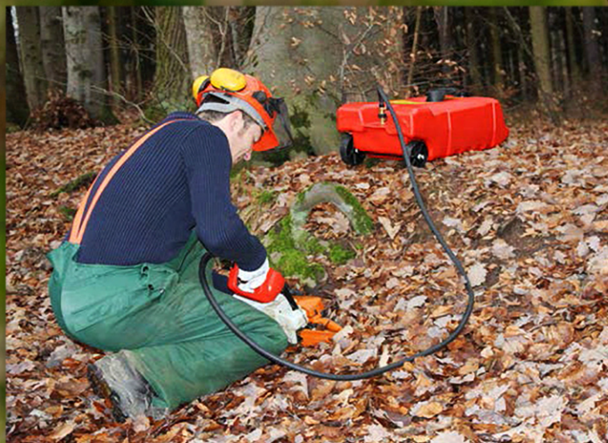
Sugerencia de uso